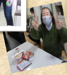
景品も楽しみですね