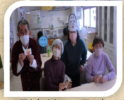
豆とあめとチョコ玉です BRAVO！