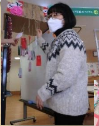
千本釣りで 景品ゲット