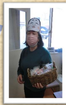
福女登場！ 豆はまかずに配りました