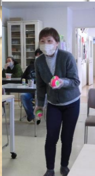
ストラックアウトで 的を狙います！